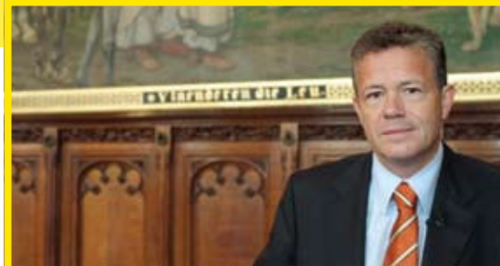
Frank Vanhecke is niet van plan zich de mond te laten snoeren.