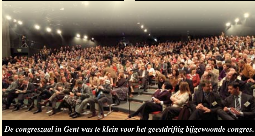
De congreszaal in Gent was te klein voor het geestdriftig bijgewoonde congres.