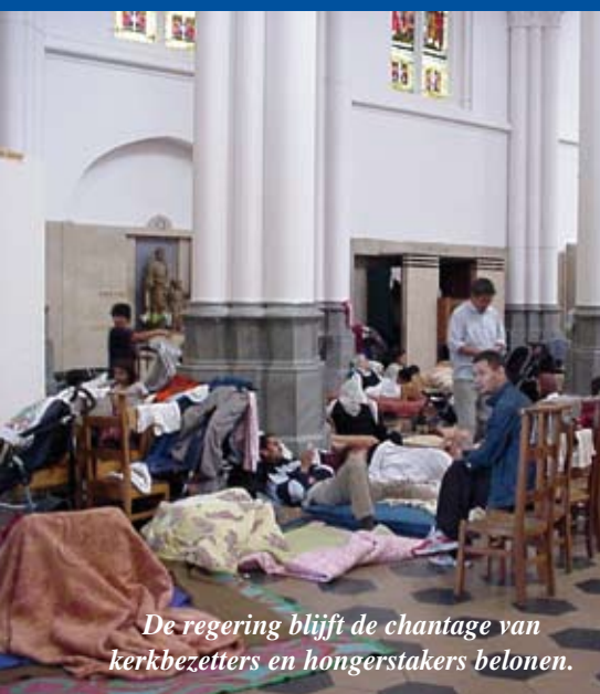
De regering blijft de chantage van kerkbezitters en hongerstakers belonen.

Minister van Binnenlandse Zaken Dewael (Open VLD) verklaarde onlangs dat hij op drie jaar tijd maar liefst 30.000 illegale vreemdelingen heeft geregulariseerd. Dat is ongeveer evenveel als de totale bevolking van Dewaels eigen stad Tongeren. De SPA en Groen