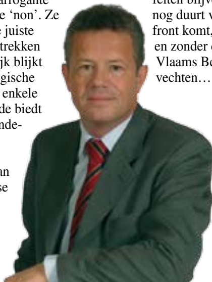
Frank Vanhecke Voorzitter Vlaams Belang

veld, en is in feite niet meer te stoppen. De vraag is hoelang de traditionele partijen nog achter de feiten blijven hollen. Hoelang het nog duurt vooraleer er één Vlaams front komt, zonder uitsluiting en zonder cordon sanitaire. Het Vlaams Belang blijft in elk geval vechten... voor uw belang.