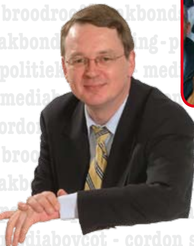
Senator Jurgen Ceder

de juistheid van de aangevoerde feitelijke elementen." Er wordt dus niet beweerd dat wat wij zeggen niet juist is, maar men weigert er gewoon over te praten. Nooit eerder werd een zo flagrant voorbeeld van gebrek aan motivering tentoon gespreid. Het ziet er steeds meer naar uit dat de veroordeling van het Vlaams Belang al bij voorbaat vaststaat.